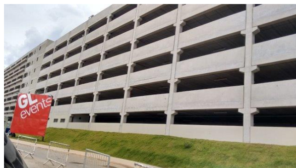
Estacionamento com 4.500 vagas