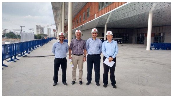
Comissão de Feiras – Vista Lateral

A CIPA Fiera Milano, nos informou que durante a EXPOSEC, no dia 11 de maio, convidará todos os expositores da FISP / FISST para um “Café da Manhã” para que todos conheçam as novas instalações e todas as possibilidades de potencializar a participação de cada expositor no evento.