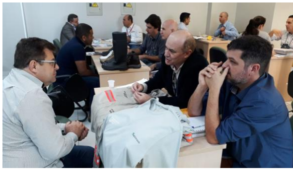
Joinville / SESI – 18.07.18