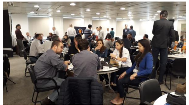
Curitiba / FIEP – 20.07.18

Para se inscrever na Rodada de Recife contatar Cintia: 11 5073-7023 ou animaseg5@animaseg.com.br