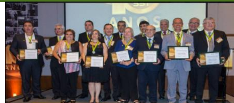
Comendadores homenageados em 2017