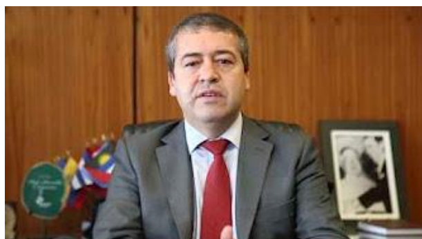
Ministro do Trabalho – Ronaldo Nogueira