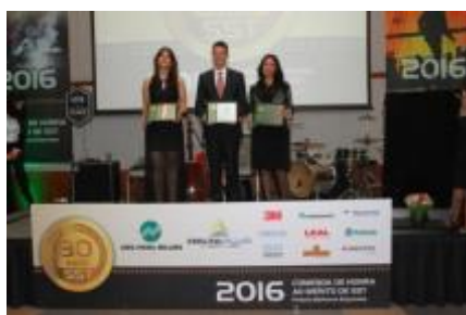
Melhores Empresas 2016

Data: 05.12.17 Horário: 19:30hs Hotel Meliá Paulista, 2181 São Paulo – SP