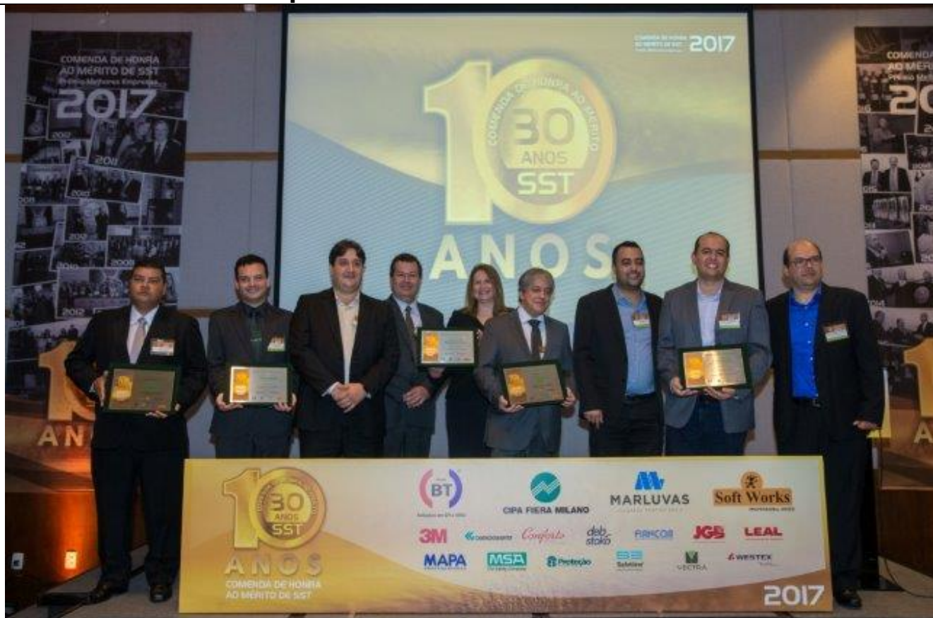
Flextronics - Hospital Oswaldo Cruz - Santanense - Tamarana - Usiminas

Homenagem aos 30 anos da Revista Proteção