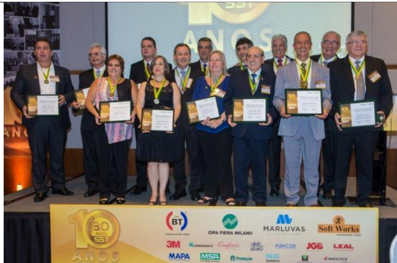
Profissionais que receberam a Comenda de SST em 2017

No último dia 5 de dezembro, foi realizado pelo décimo ano consecutivo o evento de entrega das comendas aos homenageados em 2017.