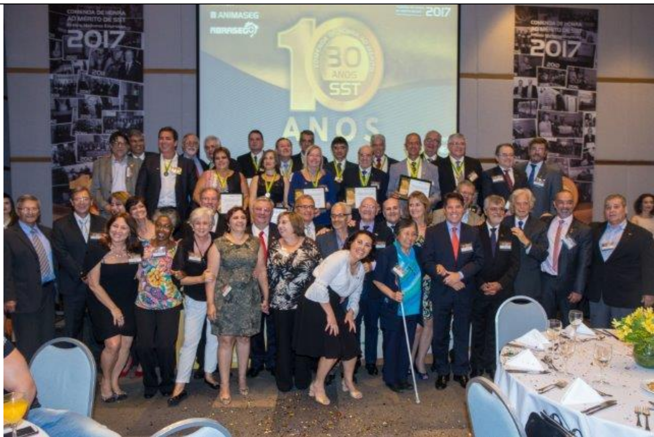
Comendadores Presentes ao evento